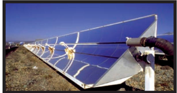
Foto 4. Lazo de colectores cilindro-parabólicos del campo ACUREX de Plataforma Solar de Almería.

- Contiene modos de ensayo virtuales para probar los controladores empleando simuladores de la planta solar. Al igual que los controladores incluidos, los simuladores están basados en modelos validados con datos reales de plantas de colectores cilindro parabólicos, como el campo ACUREX. Este modo permite entrenar a los operadores de planta sin riesgo para la instalación real.