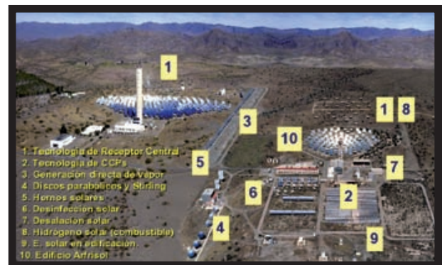
Foto 1: Vista panorámica de PSA-CIEMAT, con las distintas instalaciones científicas.

Los distintos productos desarrollados por AUNERGY se adaptan a las diferentes tecnologías termosolares actuales: plantas termosolares de receptor central, colectores cilindro parabólicos, usando como fluido de transferencia tanto aceite (monofásico) como agua-vapor (bifásico), hornos solares y sistemas de desalación con energía solar. Estos productos han sido validados en las correspondientes instalaciones de la Plataforma Solar de Almería (Figura 1). Entre los distintos productos se pueden citar HelFiCo y DCS_Control, que ofrecen soluciones avanzadas en control y operación de plantas termosolares en tecnologías de receptor central y colectores cilindro-parabólicos respectivamente. El objetivo global perseguido es optimizar, por medio de la automatización, la operación de la planta termosolar en la tecnología correspondiente. Las soluciones comercializadas, siempre en forma de software , se adaptan a las diferentes tecnologías informáticas y electrónicas existentes en plantas termosolares, con independencia de las tecnologías hardware y software utilizadas por el cliente final: desde complejos sistemas de gestión empresarial hasta integración con dispositivos de campo. Esta capacidad de adaptación dota los productos de AUNERGY de la posibilidad de adaptarse a cualquier solución informática previamente existente, reutilizando todo el hardware ya adquirido por la empresa.