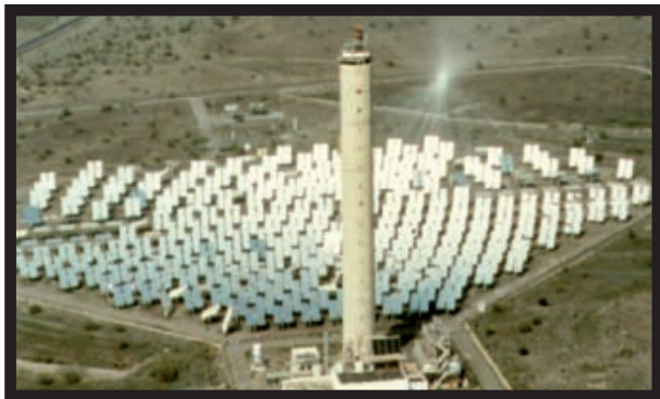
Foto 2. Planta termosolar de receptor central CESA-I de PSA-CIEMAT.

Una de las tecnologías más importantes para la conversión de la energía solar es la de receptor central, trabajando en el rango de las altas temperaturas (Energía Solar Térmica de Alta Temperatura). Estas plantas funcionan básicamente como otras