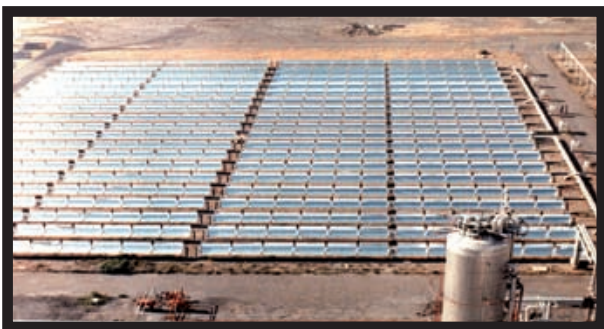
Foto 3. Vista aérea del campo ACUREX en la Plataforma Solar de Almería.